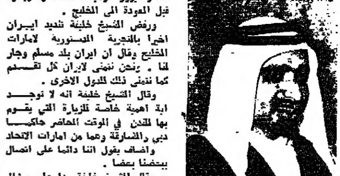
الشيخ خليفة بن حمد آل ثاني نائب حاكم قطر رئيس المجلس الاتحادي لامارات العربية المتحدة...